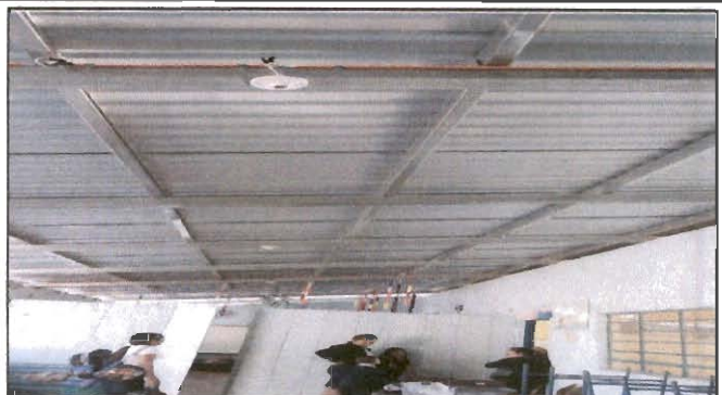
Foto 8: Colocación de lámparas en el establecimiento por carencia de las mismas